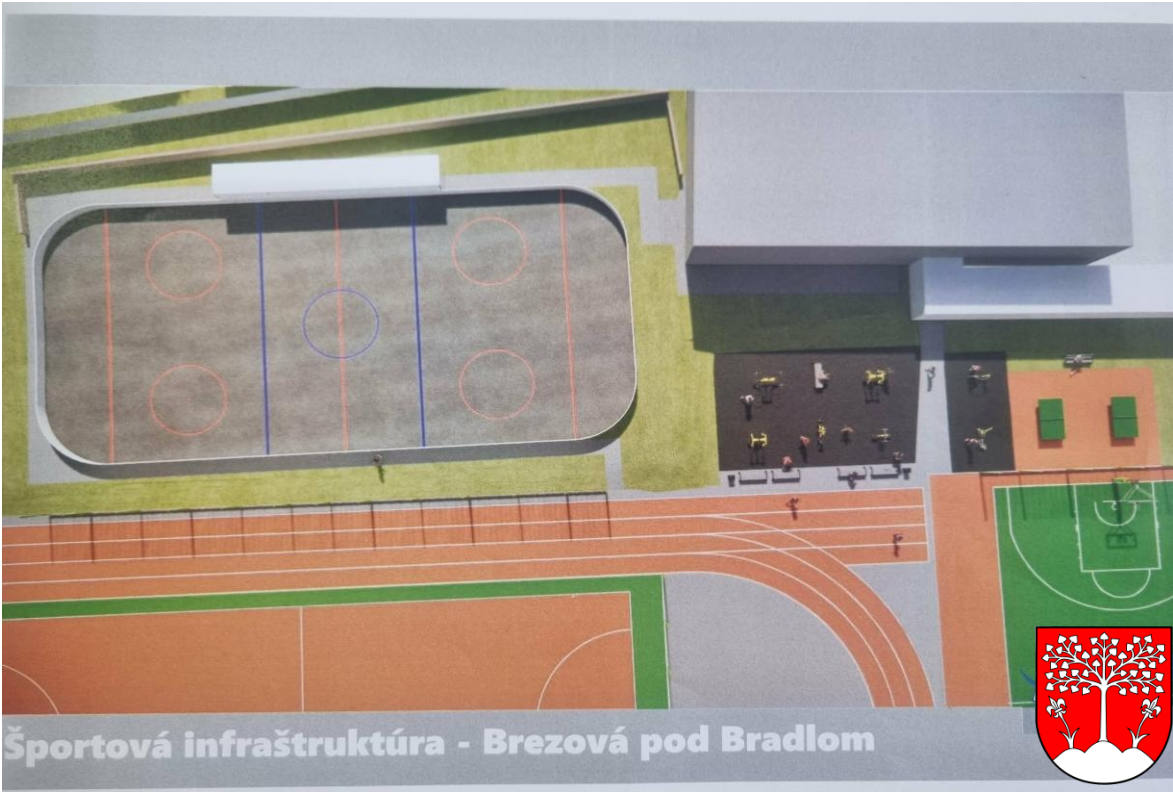
Športová infraštruktúra - Brezová pod Bradlom