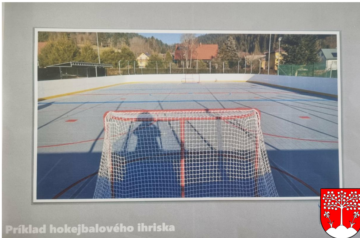
Príklad hokejbalového ihriska