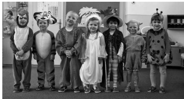
Dňa 18. 2. 2010 sa v MŠ na Sídlišku D. Jurkoviča uskutočnil karneval