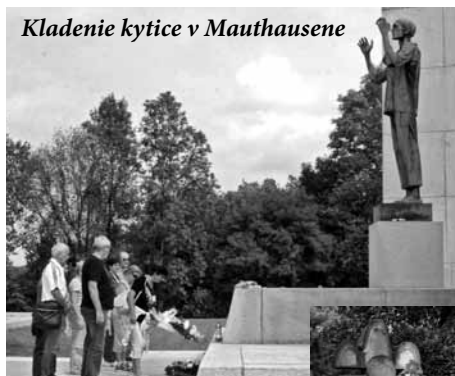
Kladenie kytice v Mauthausene

Tento rok si pripomíname 80 rokov od vypuknutia druhej svetovej vojny, najrozsiahlšieho ozbrojeného konfliktu v dejinách, ktorého sa zúčastnilo 61 štátov sveta. Počas šiestich rokov jej trvania zomrelo takmer 60 miliónov ľudí, z čoho veľkú časť tvorilo civilné obyvateľstvo. Obete, ktoré prinieslo toto vojnové besnenie, si uctili zástupcovia a sympatizanti Základnej organizácie Slovenského zväzu protifašistických bojovníkov (ZO SZPB) z Brezovej pod Bradlom v dňoch 13. – 15. septembra 2019 návštevou miest smutne zapísaných do dejín 20. storočia.