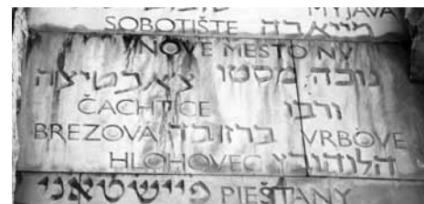
Brezová zapísaná v Jad vašem - pamätníku obetí a hrdinov holokaustu v Jeruzaleme

Tento strohý zoznam predstavuje obrovskú tragédiu. Zo 77 deportovaných 72 mužov, žien a detí neprežilo. II. svetová vojna v Brezovej tak priniesla najväčšie utrpenie židovským obyvateľom. Tvorili 72 z 84 obetí vojny v Brezovej, čo malo za následok zánik celej jednej skupiny brezovských obyvateľov. Nezabúdajme!