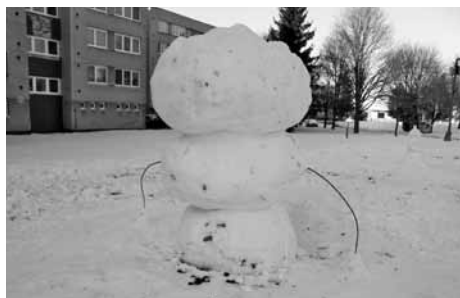
Snehuliak Akrobat z Ulice Dr. Š. Osuského