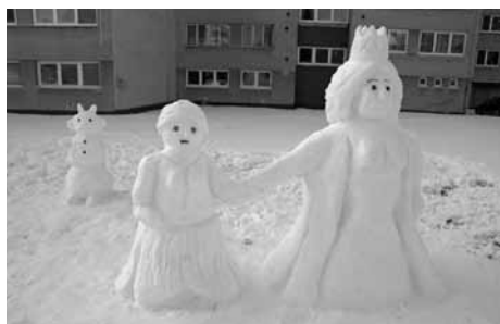
Rozprávkové bytosti z Ulice Dr. Š. Osuského

Tohtoročná tuhá zima, výnimočne bohatá na nádielku snehu, vylákala na naše sídliská a pred rodinné domy brezovských sochárov. Svojimi netradičnými dielami všetkých potešili.