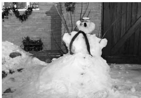
Fešák z Ulice J. M. Hurbana