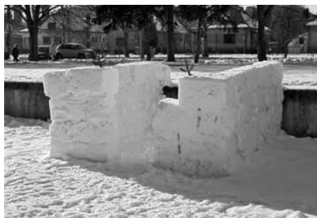
Pevnosť Boyard na Sídlisku D. Jurkoviča