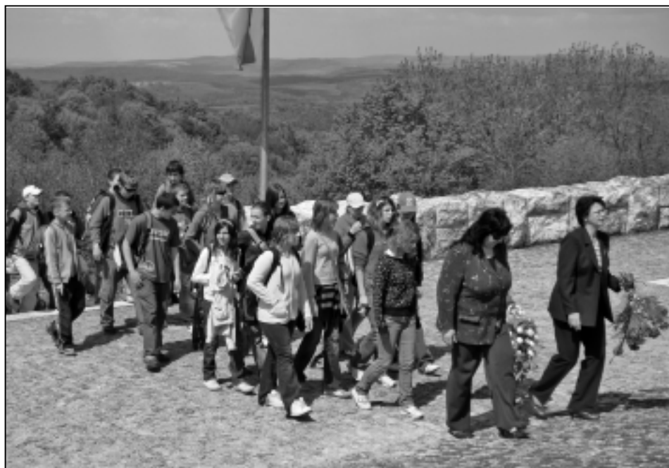
Hviezdicový pochod žiakov základných a stredných škôl na Bradlo pri príležitosti 89. výročia smrti Milana Rastislava Štefánika