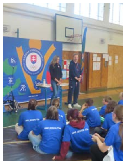
Vzácná návšteva zo Slovenského olympijského výboru - vďaka úspešnej misii našich mladých olympionikov v minulom roku