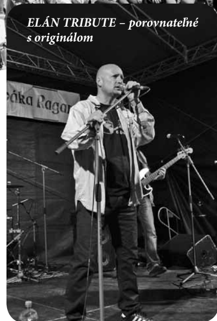
ELÁN TRIBUTE – porovnateľné s originálom