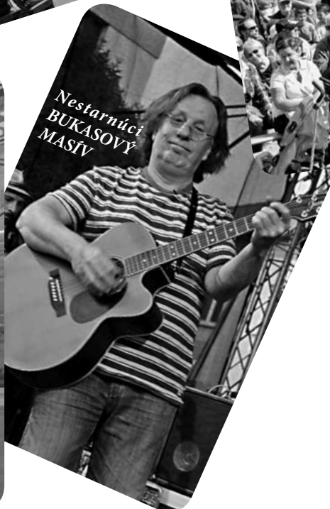
Nestarnúci BUKASOVÝ MASÍV