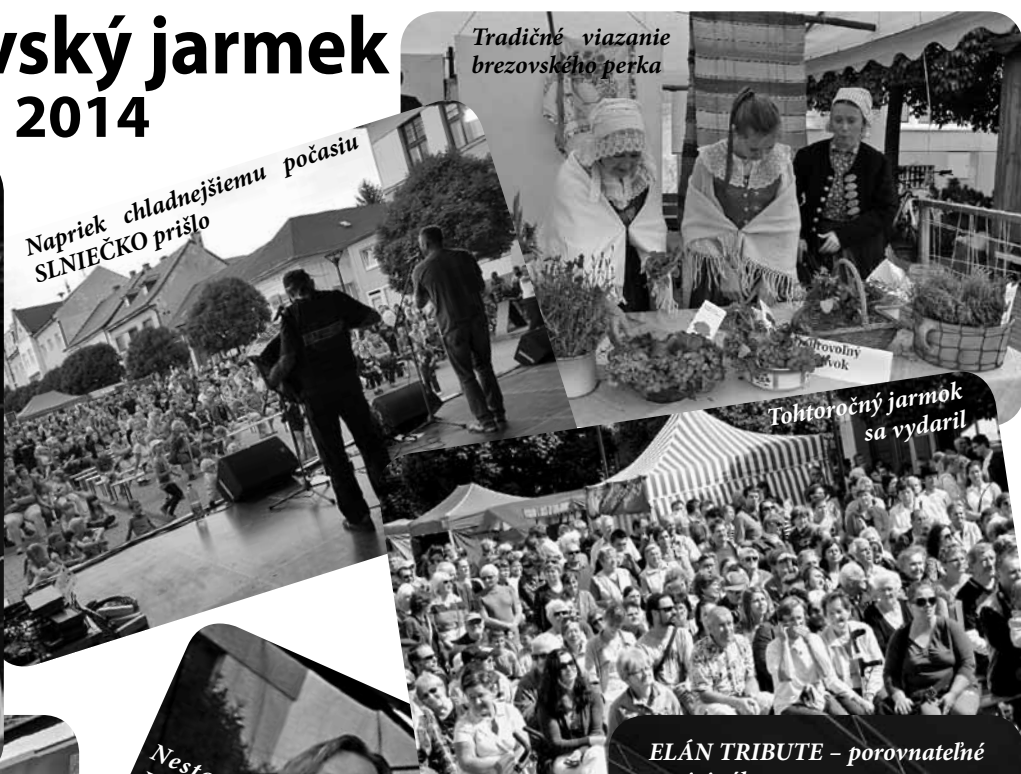
Napriek chladnejšiemu počasiu SLNIEČKO prišlo