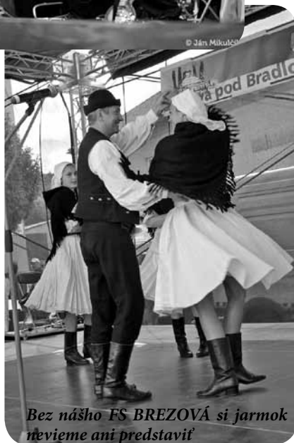
Bez nášho FS BREZOVÁ si jarmok nevieme ani predstaviť